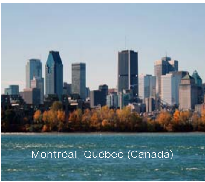
Montréal, Québec (Canada)